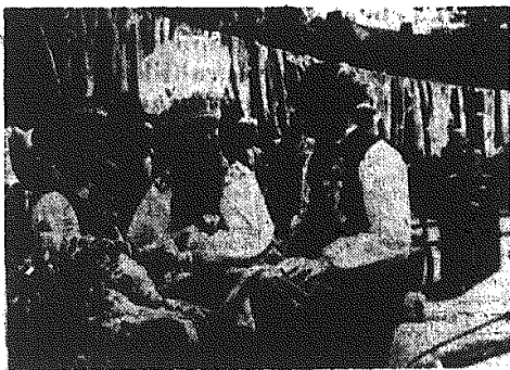
15 bm. odbyło się w Łowiczu uroczyste otwarcie „Dni Łowicza“. Najciekawszą imprezą z pierwszego dnia był przejazd ulicami miasta korowodu weselnego. Na zdjęciu: fragment korowodu weselnego.