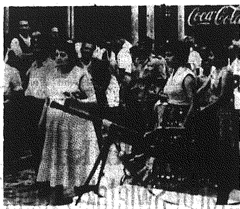
W Nikozji przerwano na godzinę stan wyjątkowy, by umożliwić mieszkańcom zaopatrzenie się w żywność.