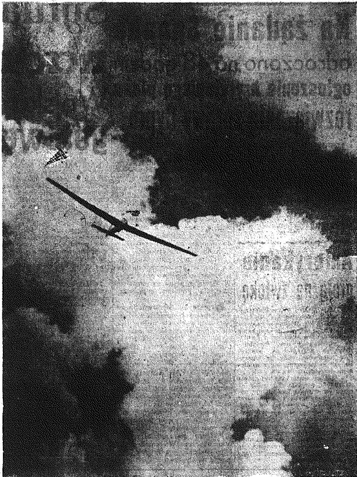
Pierwsze szybowce wyruszają na trasę konkurencyjną.