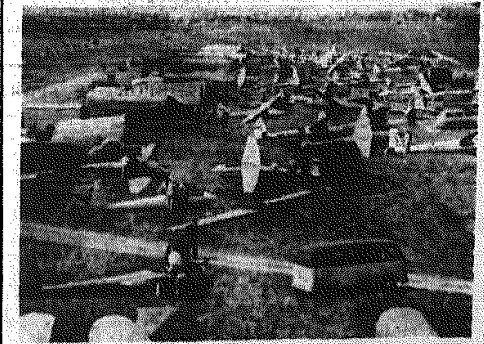
Ogólny widok lotniska przed startem.

W 42 losowaniu, które odbyło się 15 czerwca w Kielcach — Komisja, przyznając 20 grających za trafne skreślenie 4 liczb po 1400 zł oraz 534 grających za trafne skreślenie 3 liczb po 55 zł. Nikomu z grających nie udało się trafnie skreślić ani 5 ani 6 liczb.