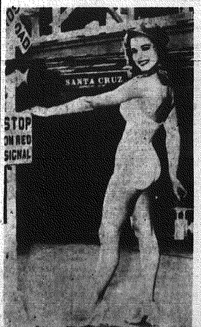
Stad — czerwone światła! CAF

W bieżącym roku zbiórki uliczne przeprowadzane będą w dniach 20 i 22 lipca, w 14 rocznicę powstania Polskiego Komitetu Wyzwolenia Narodowego. — rocznicę wyzwolenia spod jarzma hitlerowskiego. 14 lipca 1419 roku i 22 lipca 1944 roku mają wspólną wymowę. Przypominają społeczeństwu polskiemu niebezpieczeństwo militarystyki niemieckiej. Dłatego w budowie Pomnika Grunwaldzkiego na pewno weźmie udział cały naród, aby chociaż skromnym datkiem wyrazić swój hołd walczącym na polach Grunwaldu.