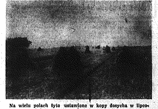
Na wielu polach było ustawiono w kopy dosyć w lipcowym słońcu.