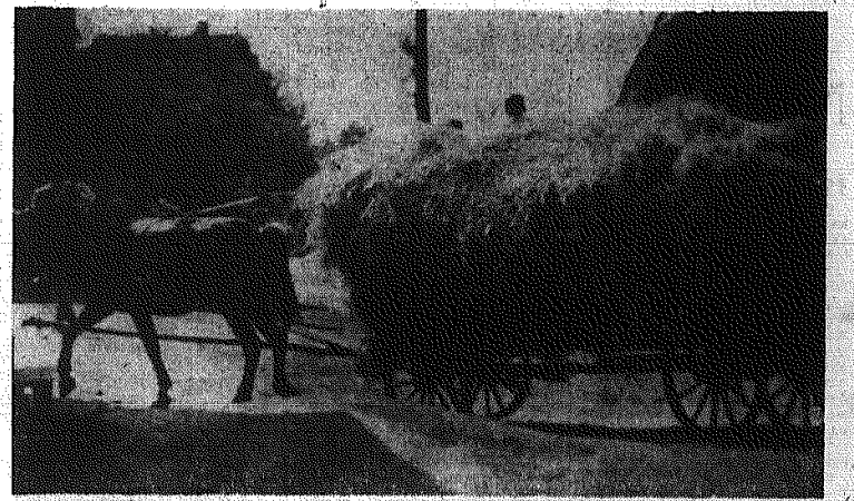
Wysoko ładowane drabiniaste wozy zwożą już tegoroczny plan do stodoł.

W 47 losowaniu w dniu 20 lipca br. padły następujące liczby: 35, 27, 36, 30, 14, 49. Nagrodę rzeczową: motocykl wygrał Nr band: 046715 z punktu Nr 8, ul. Sienkiewicza 35 w Kielcach.