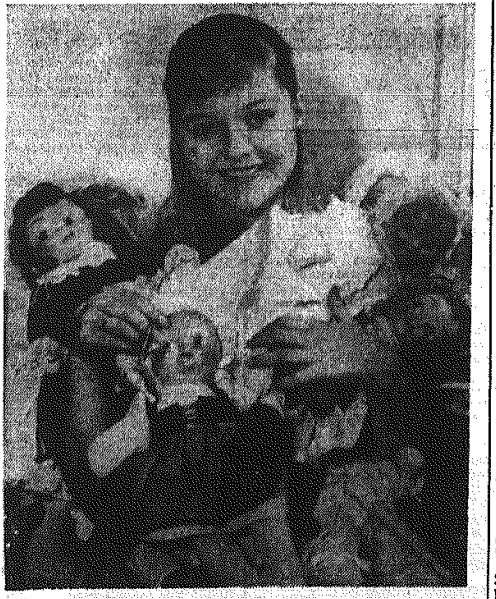
Czy to obfitość lalek ma świadczyć o skłonnościach macierzyńskich młodszukielki aktorczki Carol Lynley? Nie wiemy. Możemy natomiast podać, że dzieciaki naszych redaktorów orzekły jednomyślnie, że takie są fantastyczne. Na akcie nie zwróciły uwagi.

Przy dyskusyjnym nad przemyśleniem motoryzacyjnym wymienia się, że w r. 1975 powinniśmy mieć więcej wyprodukować ok. 200 tys. samochodów osobowych.