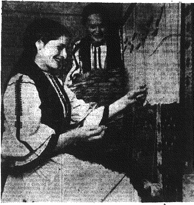
Na zdjęciu: tkanie dywanów w spółdzielni w Sibit (Rumunia)