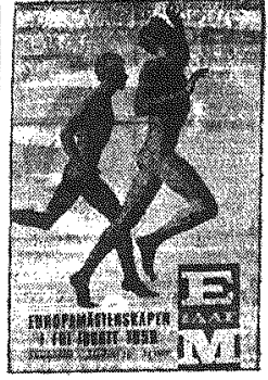
(Dokończenie ze str. 1)

Po czwarte: Niech mamuśki się lepiej płużnią swoje pociechy, bo wśród ofiar jest sporo dzieci.