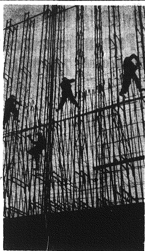
Zdjęcie z budowy? — Tak, ale stopni wodnych w górnym biegu Wisły. Ukończono budowę stopnia w Przewoźnie koło Nowej Huty, wykańcza się stopień w Dąblu koło Krakowa oraz w Łęczanach. Jednocześnie buduje się kanał Łęczany — Skawina, który skróci żeglugę oraz doprowadzi wodę do elektrowni w Skawinie. Jednym z etapów budowy kanału jest budowa śluzy w Podborach koło Skawiny. Sluza ta będzie należała do najbliższych w Polsce (różnica poziomów wody wyniesie około 15 m).

Na zdjęciu: zbrojarze przy pracy (śluz w Podborach).