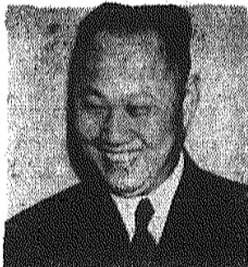
Ambasador ChRL w Polsce Wang Ping-nan

DZIŚ w Warszawie rozpoczęcie rozmów Chiny — USA