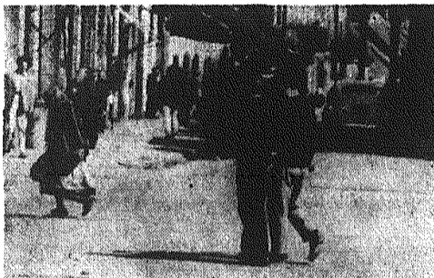
Mieszkańcy Kielce chodzą po mieście jak im się tylko podoba.

Akcja, zorganizowana w ubiegły piątek przez wydziały komunikacji drogowej Prezydium WRN i MRN w Kielcach wykazała, że większość naszego społeczeństwa nie umie chodzić po ulicach. Ludzie przekraczają jezdnię w miejscach niedozwolonych, spacerują po jezdni, naruszając się tym samym na różnego rodzaju wypadki.