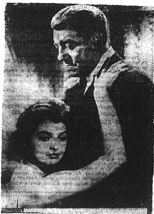
Obok doskonałego aktora Jean Gabin...