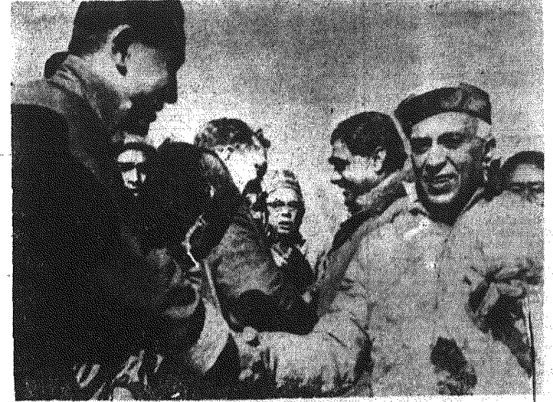
Oficer Chin Ludowych wita premiera Indii Nehru, przybyłego do Tybetu. Premier Indii dokonał otwarcia nowej drogi łączącej Tybet z Indiami.