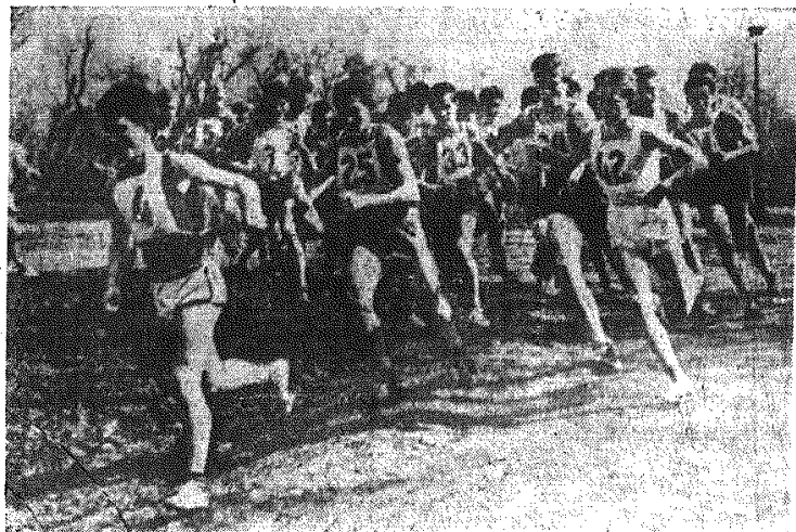
Jesteśmy na dobrej drodze do umasowienia „królowej sportu“.