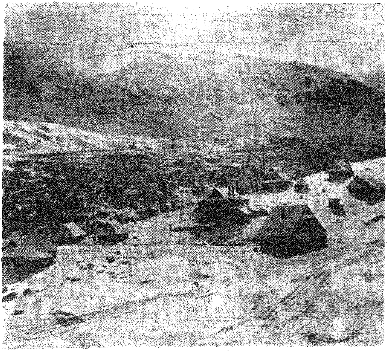
Na zdjęciu: Hala Gasienicowa pokryta grubą warstwą śniegu.