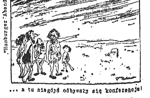
... a tu niegdyś odbywały się konferencje