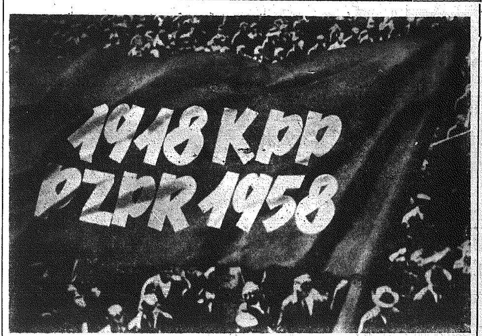
PLAKAT NA 40-LECIE KPP według projektu M. Bermiana — wydany przez WAG.