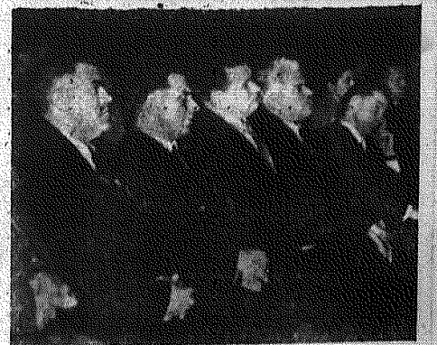
W akademii wzięli również udział członkowie działający w Kielcejskiej partyjnej delegacji z Winnicy.

Jak informuje komisja, pogrzeb odbędzie się na cmentarzu w dniu 17 bm. o godz. 11. Trumna ze zwłokami będzie wystawiona na widok publiczny w Sali Kolumnowej Sejmu w dniach 16 bm. w godzinach 18 — 20 oraz 17 bm. od godz. 9 do chwili eksportacji na Cmentarz Powązkowski do Alei Zasłużonych.