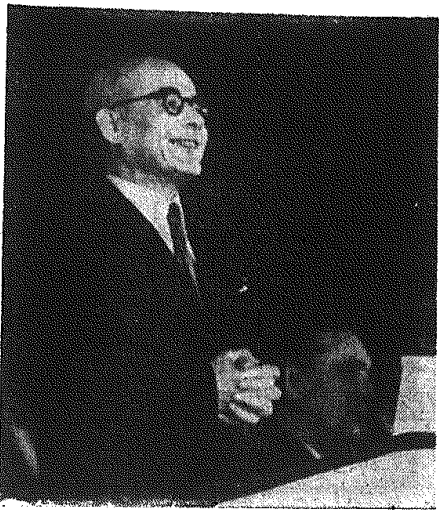
Centralna Akademia w Warszawie. Na zdjęciu: przemawia I sekretarz KC PZPR Władysław Gomułka.