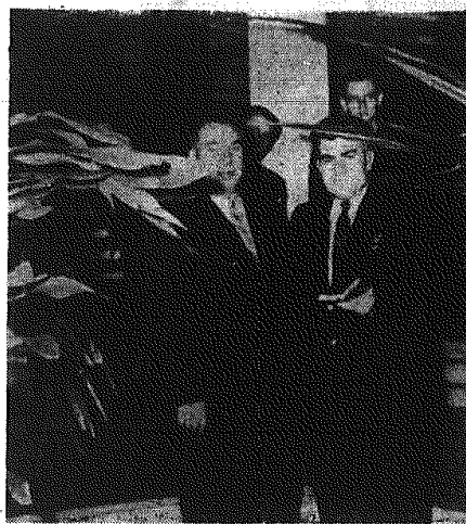
W czasie pobytu w Warszawie goście radzieccy z Winesley odwiedzili Pałac Kultury i Nauki