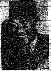
Prezydent Indonezji Sukarno.

Na zaproszenie przewodniczącego Rady Państwa PRL przybywa dnia 29 bm. z oficjalną wizytą do Polski prezydent Republiki Indonezyjskiej — dr Sukarno. Jak się dowiadujemy, prezydent Sukarno wraz z towarzyszącymi mu osobami przybędzie do Warszawy samolotem który wystąpi na lotnisko Okęcie około godz. 17. Po uroczystym powitaniu na lotnisku, prezydent Sukarno razem ze swoją żoną i przybyłymi z jego powitaniem osobistościami uda się do swej rezydencji na ul. Okęcie, ul. Żwirki i Wigury, ul. Raszewska, Al. Jerozolimskie, ul. Marszałkowska, Al. Wyzwolenia, Al. Ujazdowskie i Belwederska. (Na str. 2 podajemy życzenia prezydenta Sukarno)