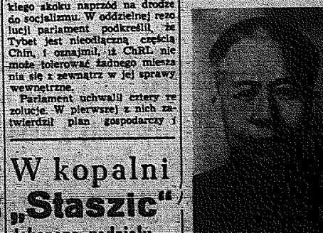
Przewodniczący Chińskiej Republiki Ludowej Lin Biao.

Mao Tse-tung honorowym przewodniczącym Ogólnochińskiej Ludowej Politycznej Konferencji Konsultatywnej Nowy skład rządu PEKIN PAP. We wtorek przed wieczorem w Pekinie, sala Hsui Jen Tang zakończyła się pierwsza doroczna sesja Ogólnochińskiej Zgromadzenia Przedstawicieli Ludowych (parlamentu) drugiej kadencji. W ostatnim dniu obrad 1.157 deputowanych wezwał 650-milionowy naród chiński do wytrwałej pracy, która pozwoliłaby Chinom dokonać nowego wielkiego skoku naprzód na drodze do socjalizmu. W oddzielnej rezolucji parlament podkreślił, że Tybet jest nieodłączną częścią Chin, i oznajmił, iż ChRL nie może tolerować żadnego mieszania się z zewnątrz w jej sprawy wewnętrzne. Parlament uchwalił cztery rezolucje. W pierwszej z nich zatwierdził plan gospodarczy i