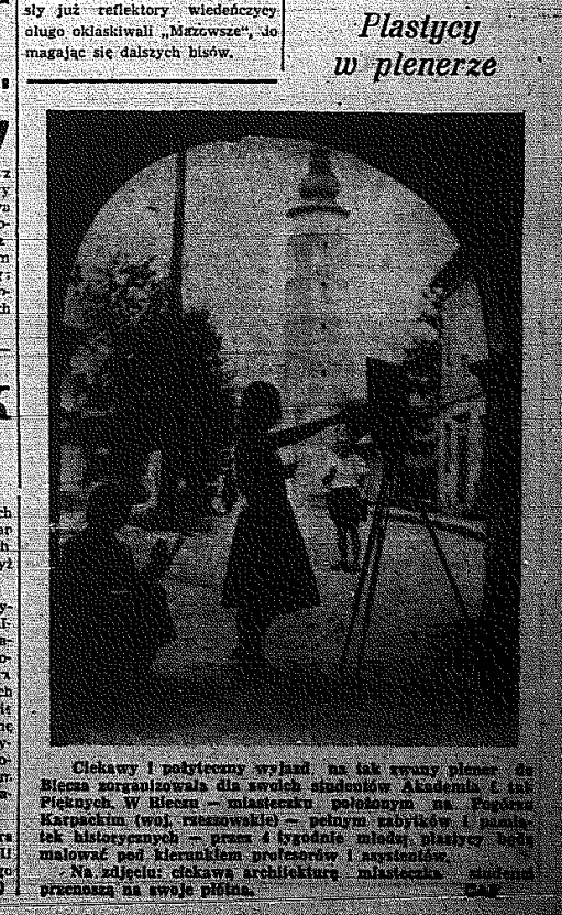
Ciekawy i polityczny wyjazd na tak zwany plener do Biecha zorganizowała dla swoich studentów Akademia i Instytut Pięknych w Biechu - miasteczku położonym na Pogórzu Karpackim...