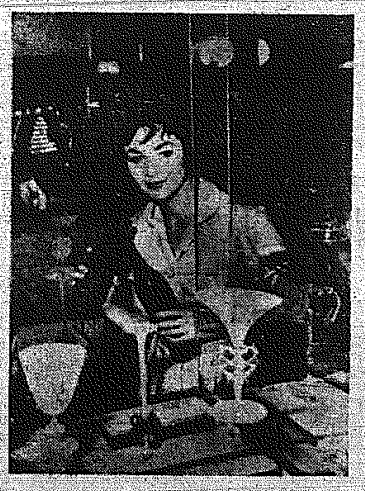
Piękna pani podziwiała eksponaty zgromadzone w Monachium z okazji odbywającej się tam konferencji ekspertów w sprawie produkcji szkła.

W br. powiat opatowski otrzymał ponadto 2,5 miliona złotych na budownictwo dla terenów nie objętych zniszczeniami wojennymi.