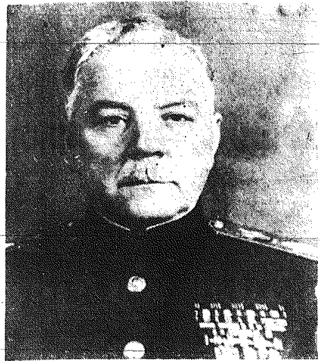
Dzisiaj mija 79 rocznica urodzin członka Prezydium KC KPZR, przewodniczącego Prezydium Rady Najwyższej ZSRR K. J. Woroszyłowa.