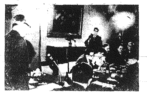
Na zdjęciu: wicepremier E. Szyr przemawia na konferencji prasowej w ambasadzie PRL.

Proletariusze wszystkich krajów łączcie się!