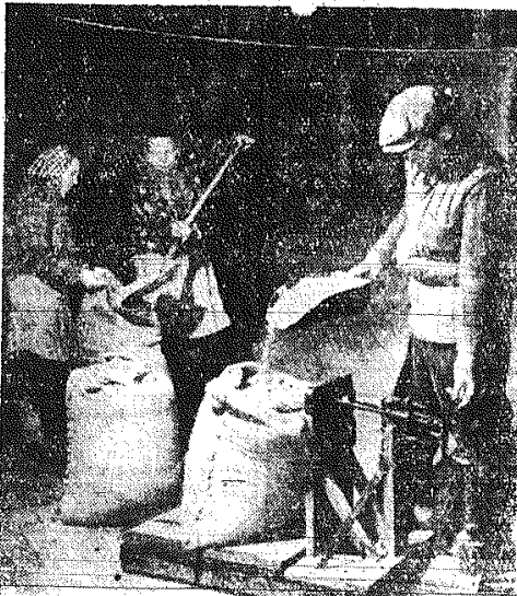
W wszystkich gospodarstwach rolnych, dostarczających rolnikom kwalifikowanych nasion na wiosenne siewy, wzięta praca, aby zdążyć w terminie z dostawą ziarna.