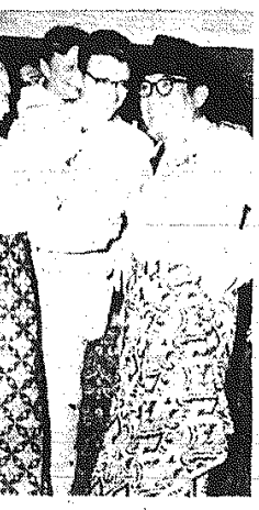
Batfokwane (kanjany — powszechnie noszone w Indonezji) jako sarongi — przytoczyli premier Chruszczow i prezydent Sukarno na wystawie rzemiosła w Jogjakardzie.