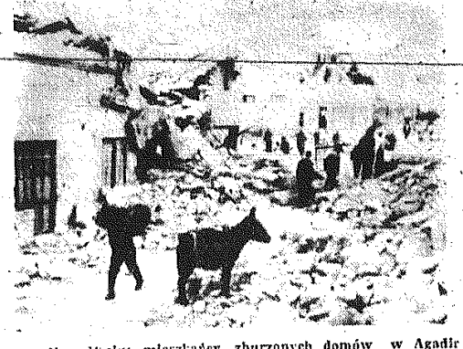
Na zdjęciu: mierzędzy zburzonych domów w Agadir.

Aktualnie pływak KSZO zajmuje obecnie pierwsze miejsce na krajowych listach seniorów na trzech dystansach: 200, 400 i 800 m.