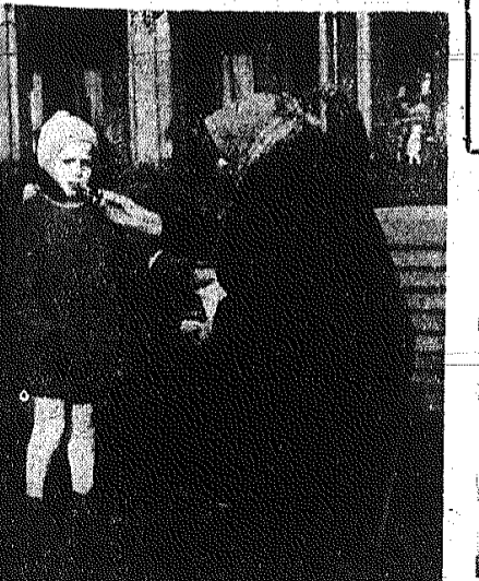
Babcia z wnuczką CAF - fot. Miedza