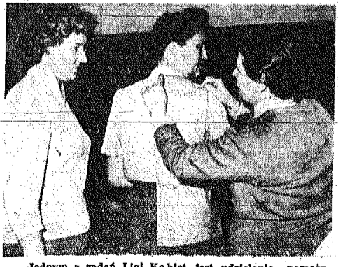
Jednym z zadań Ligii Kobiet jest udzielanie pomocy kobietom pracującym poprzez organizowanie różnego rodzaju kursów z zakresu gospodarstwa domowego.

na Umetel, pow. Opoczno). Przez pewien czas była sekretarzem Prez. PRN w Starachowicach, a po ukończeniu centralnej szkoły przy KC, czyli od 1954 roku jest przewodniczącą Prez. PRN w Kozienicach. Jej pasją żywota jest praca zainicjowana o której mówi zawsze z ogromnym ożywieniem. Ostatnie jej „kobby“ to budowlanostwo szkół. W roku liczącym w pow. Kozienice zostanie oddanych 7 szkół - do dwóch już uczęszczały dzieci. (Jedna to Pomnik Tytułowej - buduje Warszawski Okr. Wolski). W stanie surowym będą oddane 3 szkoły. Przez to go rozpocznie się budowa szkół w Śmigłowie, a w czynnie społecznym w Strzyżynie i Opatkowicach. (Plan zakłada na SFBS w roku ub. wykonano w 101 proc.).