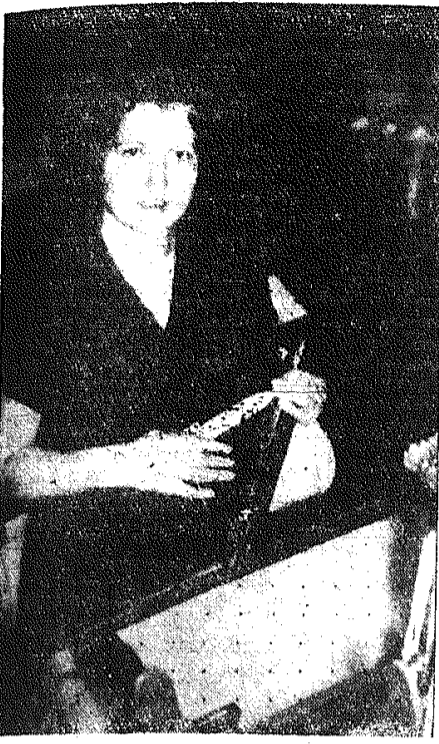
Młoda robotnica CAF - fot. Rozmysłowicz