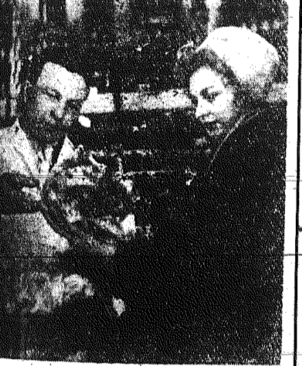
W czasie zakupów gospodarskich CAF - fot. Radziszewski