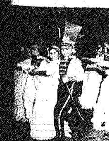
W części artystycznej m. in. wystąpiły przedszkolaki