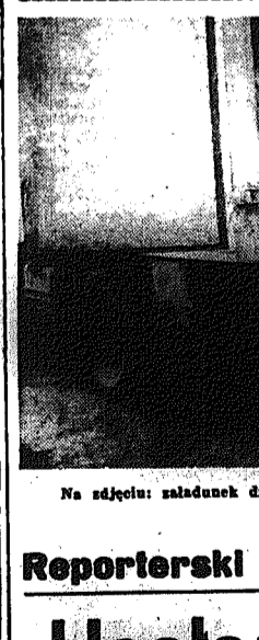
Na zdjęciu: saladunek drobnego pieczywa do samochodu.