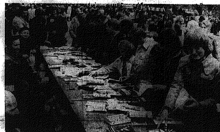
Na wczorajszym kiermaszu w kieleckim parku licnie dopisała młodzież.

W setkach miast i wsi roz poczęły się wczoraj kiermasze książek, zorganizowane w ramach Dni Kultury, Oświaty, Książki i Prasy. W związku z obchodem w br. jubileuszem dziennika „Prawda” — organu KC KPZR — dzień 5 maja ogłoszony został Dniem Prasy Radzieckiej.