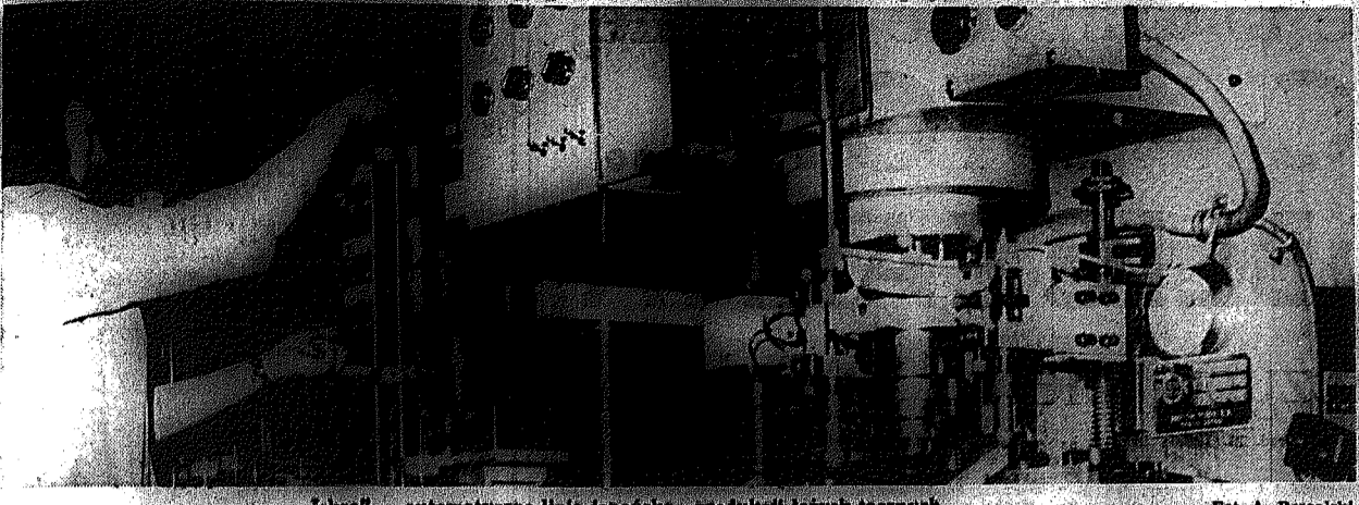
"Izara" — automatyczna linia japońska produkcji łożysk tocznych.