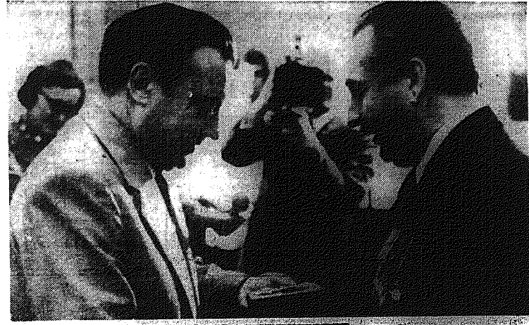
„Warszawa — 74” Młodzież kielecka przed spotkaniem w Warszawie