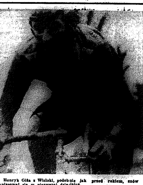
Henryk Gita z Wisłoki, podobnie jak przed rokiem, znów uplasował się w pierwszej dziesiątce.

Filipek Dolmel Wrocław wygrał wyścig na 3 tys. m — w czasie 3.50,2, przed mistrzem Europy Rychlickim Bron Radom. W wyścigu tandemem triumfowała para Ogniwa Szczecin Drog — Nowak, a w wyścigu drużynowym — zespół Dolmela Wrocław.