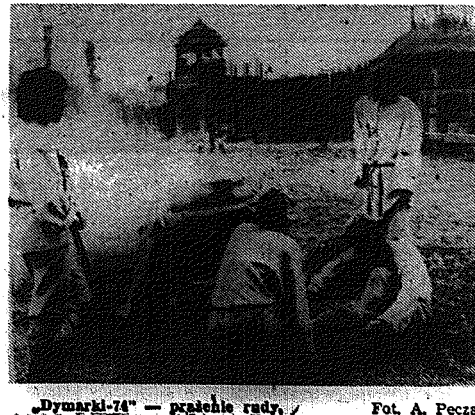
„Dymarki-74” — przebieg imprez.

Stworziliśmy ją tak dostosowując rozkład zajęć, by wszystko pogodzić. Na, w poniedziałki, które są dniami wolnymi, po meczach niedzielnych, rozmawiamy 6 godzin lekcyjnych przed południem. A licząc w tygodniu przelicza się na naukę 18 godzin. Za weekendy jest oczywiście, mówię tak, to wszystko sponowić się w praktyce. Może pewnych korekt trzeba będzie dokonywać „na bieżąco”. Przyjaliśmy wchowywawo ten klasę. Dodam jeszcze że cały cykl nauki trwa trzy lata. Potem kto chce, będzie mógł przystąpić do egzaminu maturalnego. (ju)