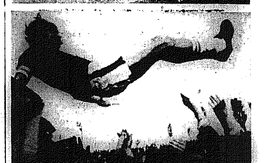
Bewiejsze ostatnich dni są piłkarze Stali ze Stalowej Woli. Od porażki w Starachowicach wygrali trzy kolejne mecze bez straty bramek, przy strzelaniu aż 9, i są nowym przedmiotem grupy południowej. Spora niespodzianka. Ta kolejka przyniosła konieczną porażkę remisów, aż sześć w ośmiu spotkaniach i jedną sensacją w postaci porażki Odry na własnym boisku z ostatnim dotąd Metalem.