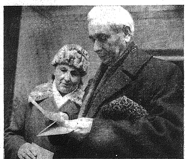
Władysław Skorek, jedyny na Kielcach odznaczony Orderem Budowniczych Polski Ludowej z małżonką, w momencie przed głosowaniem.

Obwodowa Komisja Wyborcza nr 103 pracowała w lokalu warszawskiego Instytutu Medycznego nr 1 przy ul. Parkowej. Na dzień głosowania słuchacze szkoły, przystroili gmach odświeżenie biało-czerwone flagi, zieleni i kwiaty. Tuż przed godziną 9 w sali, gdzie głównym gościem dekoracyjnym jest temat warszawskiej Syrenki, głosuje HELENA PROKSIŃSKA — nauczycielka od 12 lat wychowująca polską młodzież. Właścicielka mała, wesoła, widać jeszcze zadobrowo czynna. W chwili po niej do lokalu wyborczego przybywa i sekretarz KC PZPR EDWARD GIEREK wraz z małżonką ANISIAWĄ . Obydwoje widać się z przewodniczącym i członkami komisji wyborczej, przyjmują kartki z nazwiskami kandydatów na postów do Sejmu i radnych do Stołecznej Rady Narodowej. Następnie głosowanie. Po odejściu od urny wybrzy Stanisław i Edward Gierkowie bukiety biało-czerwonych goździków wręcają przedstawiciel młodzieży MALGORZATA GRUNDMAN , słuchaczka II semestru szkoły, w której mieści się stał wyborczy oraz KRZYSZTOF SOCKO z Centrali „Dziennik” dziękują i sekretarzowi KC PZPR za troskę przyszłości młodego pokolenia Polaków, czego przykładem jest pełna rozmachu,