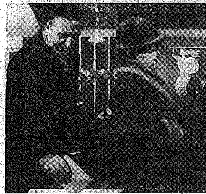
Głosują Stanisław i Edward Gierkowie.

historii kraju, program społeczno-gospodarczego rozwoju kraju zrodzony na VII Zjeździe partii. Wybory, akceptujące nie tylko kandydatów do władz, ale również nowe rozwiązania społeczno-gospodarcze, struktury władzy i państwa, umacniania socjalistycznej demokracji. Głosy, czynnie popierające przedsięwzięcia partii. Głosy, za dalszym rozwojem gospodarki, za umacnianiem potencjału i autorytetu Polski. Głosy, za dalszą konsekwentną poprawą poziomu życia ludności miast i wsi. Za większą ilością mieszkań, lepszym zaopatrzeniem rynku, dalszym rozwojem opieki i świadczeń socjalnych, pomocy rodzinie, kobiecie i dziecku. Za wszechstronnym rozwojem nauki, kultury i oświaty, za szerszym uczestnictwem ludzi pracy w rządzeniu krajem, decydowaniu o podstawowych sprawach jego rozwoju. TO MOJA WŁADZA. JEJ POMAGAM I W JEJ DZIAŁANIU PRAGNĘ UCZESTNICZYĆ.