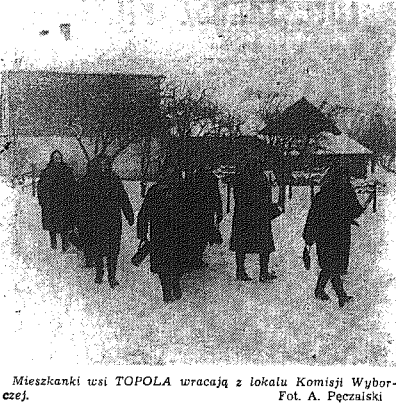
Mieszkańki tutejsi TOPOLA wracają z lokalu Komisji Wyborczej.

tu. W moim mieszkaniu przy ul. Kosnej w Radomiu zamieszkałszy znalazł powiasek, na którym odhaczał się odeszły. W nocy 15 listopada, kiedy odbijaliśmy ostatnią partię ulotek, dom otoczył granatowy polifon. Walenie dzwoniło, śledzący za mną przemaszynie Janek Rus zdolał ukryć część odbitek pod materacem łóżka, ale rewidujący szybko je znaleźli. Nie było sensu się wplerać. Tak właśnie zaczęła się moja służba politycznego działacza, szkła w której klasami było więzienie radomskie, Wroneki i wreszcie Sachsenhausen, Oranienburg, Dachau... Później przyszedł podziemna praca, zwięzły trud przy urządzaniu naszego gospodarstwa według naszych robotniczych praw... Towarzysz Józef na powrót sięga do wspomnień o organizowaniu w mieście pierwszych przedsiębiorstw handlowych, zakładów produkcyjnych, spółdzielczych, o codziennej robotcie w miejskich i wojewódzkich instancjach partyjnych. Podaje następującą datę. Blisko 30 lat uwięzzonego sukcesami wysiłku. — Nawet dziś — powiada kiedyś mógłbym już dać sobie spokój, coś elegantnie do spotkań z towarzyszami, rozmów z nimi, poznaniam ich codziennych spraw i kłopotów. Zasiedziałem się w tym mieszkaniu przy ul. Mickiewicza w Radomiu, a tu towarzysze Józef przynagla, by jeszcze dziś rzecz najważniejszą — odwiedzić w lokalu wyborczym. — Mówicie, święteczny dzień. Dni święteczny jest w kalendarzu wiele, ten zaś jest szczególny. Od niego zależy jakie będą te półtora tysiąca najbliższych dni. Wierzę, że będą coraz lepsze.