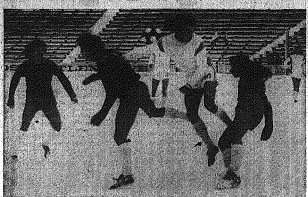
W polarnych niemal warunkach Inaugurowali, własną piłkarze Granatu w ciemnych strojach i Radomka.