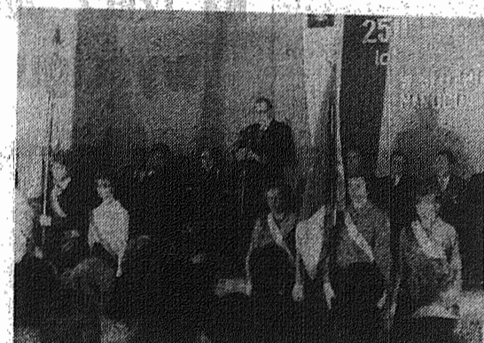
Na zdjęciu: przydym jubileuszowej akademii.