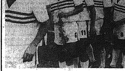
Na zdjęciu prezentujemy drugą Broni, z której 8 piłkarzy powołano do reprezentacji OZPN na najbliższy mecz.