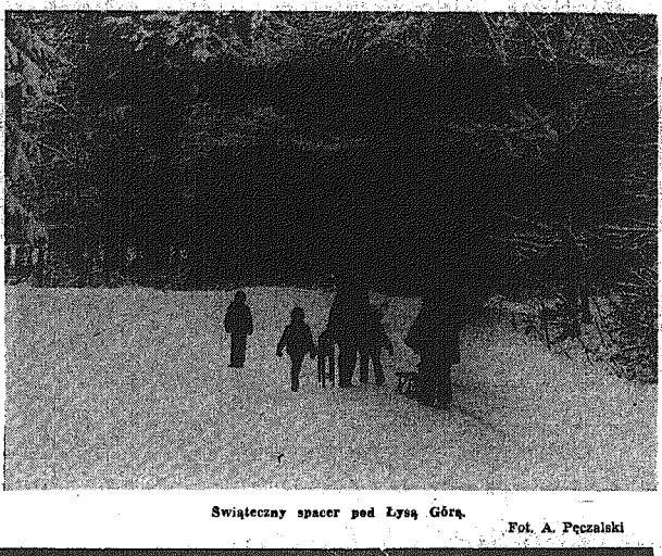
Świąteczny spacer pod Łysą Górą.