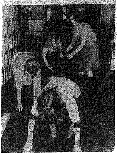
„Zorganizowaliśmy jedną „dyktando młodzież”, a w ostatnich dniach była społeczny przy porządkowaniu ich oddział...”