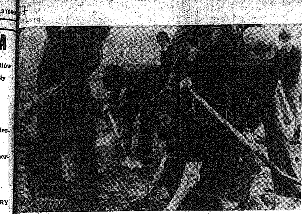
Na zdjęciu: młodzież z ZSZ przy Zakładzie Wykonawstwa Stal Elektrocznej sądzi krzewy na Wietrzal w Kielcach.