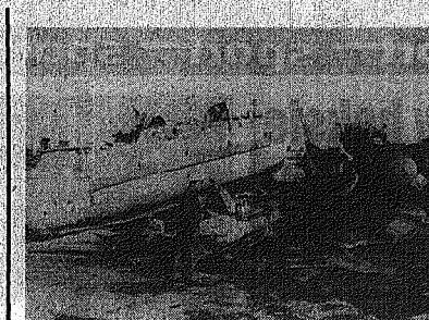
W czym przewieź tą górę żelazną?