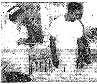
Oddział Polonijczy radomskiego szpitala.