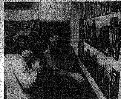
"10x10" w Radomiu... Dużym zainteresowaniem radomianie cieszy się ekspozycja w Klubie MPiK przy ul. Traugotta...