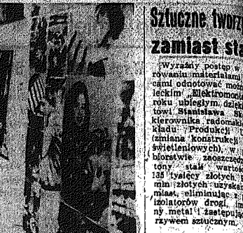
Sztuczne tworzywa zamiast sta... Wzrosty postępu w rozwoju materiałów...