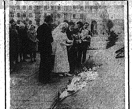
Na całym świecie widnia sprzyja zawieraniu małżeństw. W Orlowie Radzieckim tradycyjnym już przyjęciem stało się składanie przez nowożeńców kwiatów pod pomnikami.