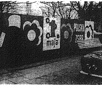
Warka spობi się do 1-majowego święta

Dziś zachmurzenie duże w większymi przejaśnieniami. Mijającą noc i wczesny poranek. Temperatura lokalnych mgieł. Temperatura maksymalna od 8 do 13 st. Wiatry umiarkowane i dość silne, okresami silne i podburzające w porach od 20 m/sk.