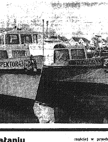
Wielkie uwadze do