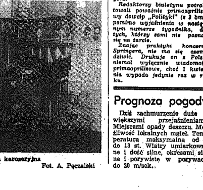
Thozala karoseryjna