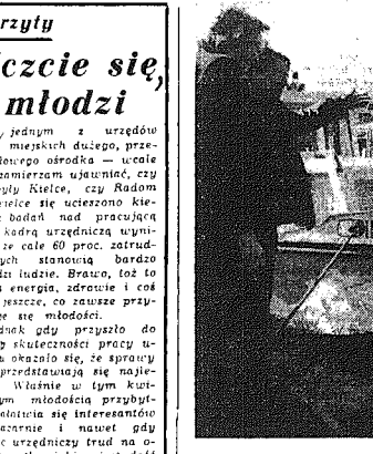
Wielkie uwadze do