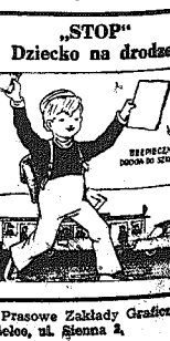
Prasowe Zakłady Graficzne Kielce, ul. Sienka 2.