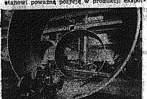
Największą produkcją eksportową przeliczają do Związku Radzieckiego oferte kielecki „Chemur”.

DOKONCZENIE ZE STR. 1 Na rynek radziecki trafia również: bielizna z Jedynowego Zakładu, buty z Kieleckiej Fabryki Pomp, „Białogon” ubrania z Ostrowieckiego „Medeksa”, bukiety świeżące ze Skarżyskich Zakładów Obuwia, farby z Białonickiej Fabryki Farb i Lakierów, odzież z radomskiego „Modaru”, aptochemię z „Wapolek”, „Kowent”, buty ze spółdzielni „Buz” w Kosińskich. Sprzedają towary do Związku Radzieckiego stowary poważną pozycję w produkcji eksportowej wielu zakładów. Np.: KFP „Białogon” i „Chemur” 70 proc. wyrobów sprzedanych za granicę wysyła do ZSRR, Radomska Wytwórnia Telefonów — 90 proc., „Mesko” — 25 proc., „Walter” prawie 20 proc.