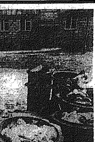
Taki obracek uchwycił nasz fotoreporter w radomskiej dzielnicy Zamlinie. Nie najlepší świadczy ten balażnik o gospodarstwie osiedla...

niewie szkół budowlanych. Ale dawno już ich tutaj nie widać. Sporo do życia pozostawia ono przed dworcem PKP. Do jego wyglądu nie przykładają większej wagi ani kierow-