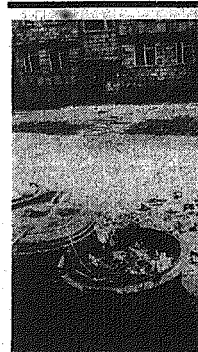
Taki obracek uchwycił nasz fotoreporter w radomskiej dzielnicy Zamlinie. Nie najlepší świadczy ten balażnik o gospodarstwie osiedla...

Dyrektor Rejonowego Przedsiębiorstwa Gospodarki Mieszkaniowej w Kielcach — mgr Gerard Bednarski informuje, że alkwirowano przedkole dachu nad mieszkaniem nr 29 przy ul. Zelaznej 29. Remont wykonał Rejon Eksploatacji Budynków nr 11. Za przebudowę określona wykonania prac udzieliłno upomnienia kierownikowi rejonu.