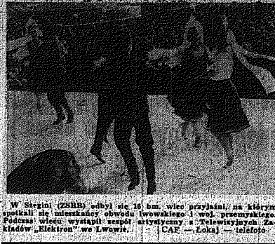
W Sępolnie (ZSRB) odbył się 16 bm. wiec przyjaźni, na którym spotkali się przedstawiciele obwodów Iwowskiego i woj. przemyskiego. Przedstawiciele władz wszystkich krajów: przytoczyli: a. Telewizyjnych Zakładów „Elektron” w Ławocznicy.