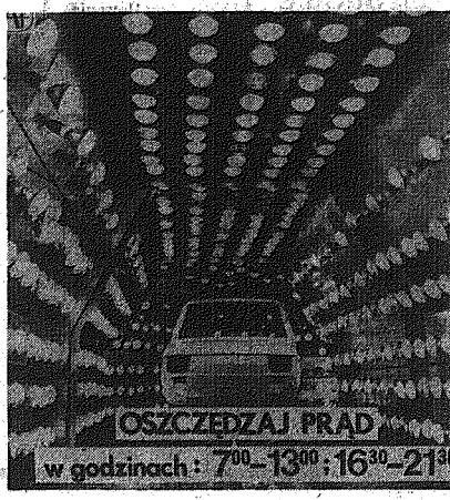
OSZCZĘDZAJ PRĄD w godzinach: 7 00 -13 00 ; 16 30 -21 30

gwieźdźca i dość wysokiej faili. Marynarza, który znalazł się w stanie skrajnego wyczerpania, otoczono opieką.