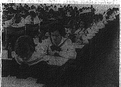
Na granicze pisemnym w radomskim Liceum Ogólnokształcącym im. Marii Kosopkiewicz.