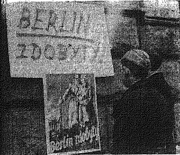
8 maja 1945 r. — pierwsze plakaty