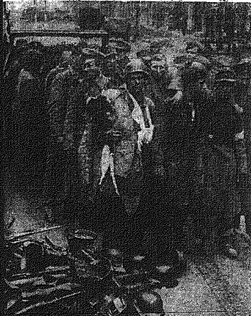
9 maja. W kwatrze głównej gen. Eisenhowera w Reims...