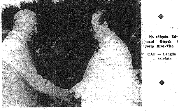
Na zdjęciu: Edward Gierek i Josip Broz-Tito.

zabierali głos z trybuny Zgromadzenia Ogólnego, pozytywnie oceniali radzieckie propozycje w sprawie konkretnych zagadnień. DOKOŃCZENIE NA STR. 2