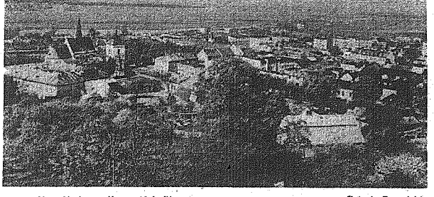
Na zdjęciu: ogólny widok Pinczowa...

W dniu 24 czerwca 1978 r. przesyłać na świat 35-milionowy obywateli PRL, w związku z tym faktem, aby każdemu dziecku urodzonym w tym dniu należały jednorazowy zasiłek w kwocie 5 tys. złotych. Zasiłek ten realizowany jest przez Zakład Wspierania Społeczności i Zarządzania, który przystąpił do przygotowania zasiłku porodowego i jednorazowego zasiłku w wysokości 2 tys. złotych, z tytułu urodzenia dziecka.