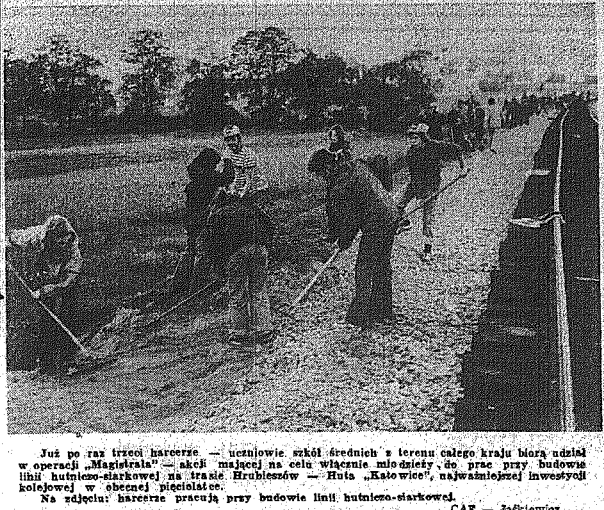
Już po raz trzeci barażerze — uczestnicy szkół średnich z terenu całego kraju biorą udział w operacji „Magistrala” — akcji mającej na celu właśnie młodzi do pracy przy budowie linii hutniczo-śląskiej na trasie Hrubieszów — Huta „Silesia”, najważniejszej inwestycji kolejowej w obrębie „Magistrali”.

Na zdjęciu: barażerze pracują przy budowie linii hutniczo-śląskiej.