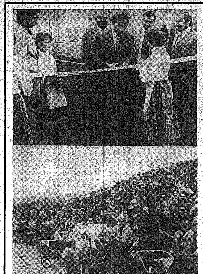
Na zdjęciach fragmenty uroczystości otwarcia stadionu w Białobrzegach. U góry — Władysława Trzaskowskiego, w środku — Władysława Trzaskowskiego, w dolnej części — Władysława Trzaskowskiego.

Tradycją naszego święta narodowego stało się oddawanie do użytku różnego rodzaju obiektów wznoszonych na potrzeby gospodarki narodowej czy społecznej. W tym roku w Białobrzegach i Miechowie powstają nowe obiekty sportowe. W Białobrzegach powstanie nowy obiekt sportowy, który będzie służył do uprawiania różnych sportów. W Miechowie powstanie nowy obiekt sportowy, który będzie służył do uprawiania różnych sportów.