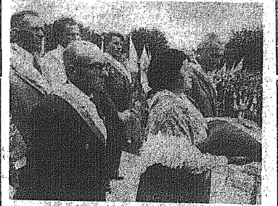
Przedstawiciele społeczeństwa wsi Konieczna z otrzymanym odznaczeniem: Orderem Krzyża Grunwaldu III klasy.