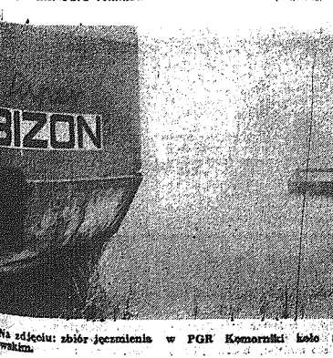
Na zdjęciu: zbiór jeździectwa w PGR Komorniki koło Brody Śląskiej w woj. wrocławskim.

K IEDY przed pięć laty po raz pierwszy zorganizowano w Kielcach Harcerski Festiwal Kultury Młodzieży Szkolnej, inicjatorzy owego przedsięwzięcia w założeniach programowych imprezy, która — jak ten czas mija — obchodzić będzie — w roku bieżącym — jubileusz 10-lecia. Festiwal ma na celu skonfrontowanie doświadczeń artystycznego zespołu, popularizację zabiegów i wartościowego artystycznie repertuaru, zaktywizowanie amatorskiego ruchu artystycznego dzieci i młodzieży oraz zorientowanie środowiska wyciecznych problematyki artystycznej i młodzieżowej. Założenia okazały się skromniejsze niż rzeczywistość. Tylko z kronikarskich zapisów, z racji bezpośrednich uczestników i obserwatorów, znam dwa najważniejsze wydarzenia z festiwalu, to owoch zaślizanych opiniotwórców, że mityng inauguracyjny w roku 1974 coroczny maraton młodzieży nie udał się w całej pełni. A może inaczej: obnażył słabości i trudności w szkolnym ruchu artystycznym, ujawnił jego niemożność i jednocześnie wskazał na potrzebę poszukiwania nowych formuł. Owa demaskatorska wymowa to już coś, to również korzyść.