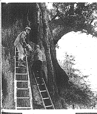
Konserwacja „Bartka” Trwają prace przy konserwacji najstarszego polskiego łobu — „Bartka”. Na zdjęciu: wymywanie starego, kamiennego trzonu, którym „Bartek” był wypełniony od roku 1922.