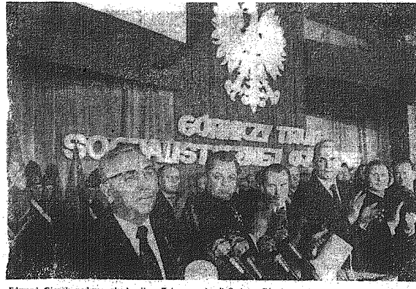
Edward Gierk podczas akademii w Zabrzcu z okazji Święta Górnika.

CAŁA Polska wyraża gorące szacunek i uznanie za kolejny rok ofiarnej pracy dla kraju. Wielestajowa grupa polskich górników tak jak i w poprzednich latach obchodzi swój legonocny święto w poczuciu dobrze spełnionego obowiązku wobec ojczyzny i wytworzył z dokonani. Załogi kopalni węgla kamiennego wydobędą w br. o 6,5 mln ton więcej węgla niż w roku ubiegłym, utrzymując wysokość tempa wzrostu produkcji. Wydajnie pracują górnicy węgla brunatnego, którzy zaspokajają już czwartą część potrzeb naszej energetyki. Z nadwyżką realizują legonocne, napięte zadania górnicy rud metali nieżelaznych, ropy i gazu, surowców chemicznych, skalnych i innych kopalin. Dzięki wyjątkowej pracy ich ręk, dzięki konsekwentnej polityce rozwoju krajowej branży wydobywczej — bogactwa polskiej ziemi coraz lepiej, coraz efektywniej służą narodowi i owocują wszechstronnym rozkwitem socjalistycznej ojczyzny.