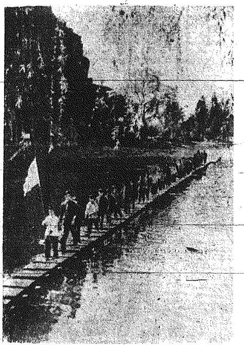
Małownice położone Kuelin w autonomiznym okręgu Kuansei zachęca do wycieczek za miasto. Na zdjęciu: Wydział pionierów.