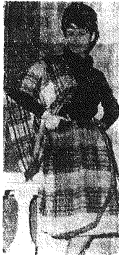
Na chłodne dni wiosny i na wyjazdy za miasto paruska „haute couture” lannej komplet z wstążą w kratę z takim samym szalem. Dopelnia całość sukni w kolorze jednego z pasteli.