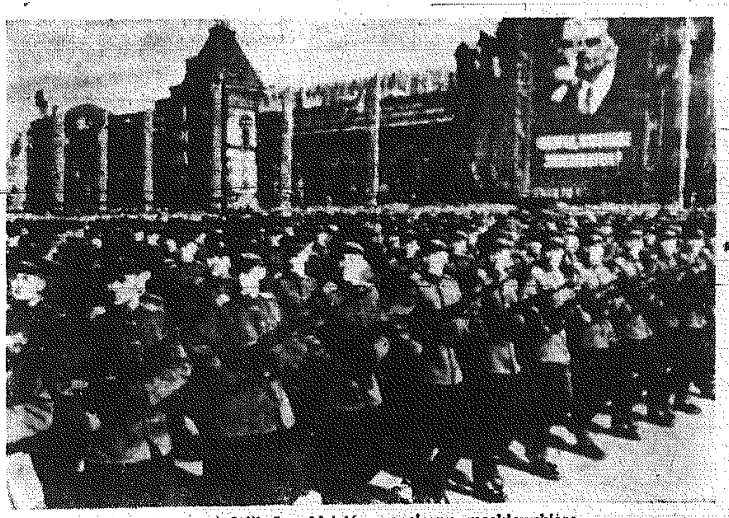
Fragment defilady oddziałów garnizonu moskiewskiego.