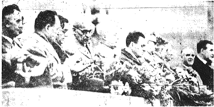
Kierownictwo partii i rządu podczas wielkiego wstępu 1-majowego na Placu Defilad w Warszawie.