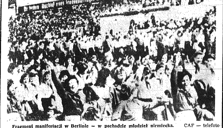
Fragment manifestacji w Berlinie — w pochodzie młodzież niemiecka.