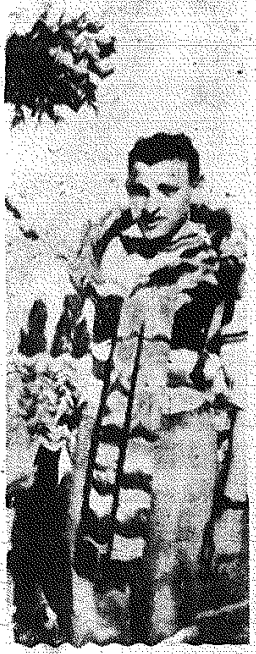
Na zdjęciu: Zygmunta II księcia Bratysławy, Czerwona (Belgia) CAF - fot. Grzęda Teletoto

Siedziba władz miejskich Stambulu, gdzie obradowała Rada NATO, otoczona była kolumnami czołgów. Czołgi rozmieszczone były również w ulicach sąsiednich. Samotne wojskowe patrolowały miasto, aby obserwować punkty, w których gromadzą się demonstranci. Według doniesień agencji France Presse, ambasador amerykański spotkał się w Stambule z premierem Menderesem. Uważa się, że ambasador zasięgał informacji o rozwoju sytuacji politycznej w Turcji.