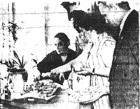
W tym czasie, gdy spoceni ze zdenerwowania uczniowie meczą się nad rozwiązaniem zadania, ich rodzice przygotowują dla nich kanapki na drugie śniadanie.