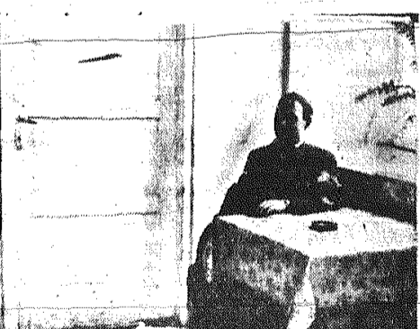
Potrzebna bezwzględna cisza! Na straży porządku i spokoju czuwa woźny szkoły.