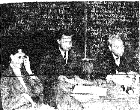
A oto szanowna komisja maturalna pilnie obserwująca przebieg egzaminów.