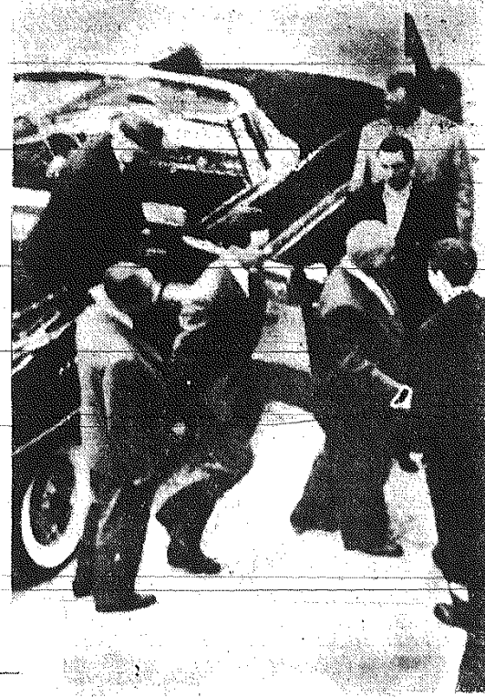
Przybyłe premiera N. S. Chruszczowa do Pałacu Elizejskiego.

W poniedziałek odwiedzili Kielce zagraniczni uczestnicy Krajowego Zjazdu Towarzystwa Wiedzy Powszechnej