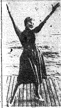
Na zdjęciu: Magali Noel — odtworzyła jedną z głównych ról w filmie Felliniego „Dolce Vita”.