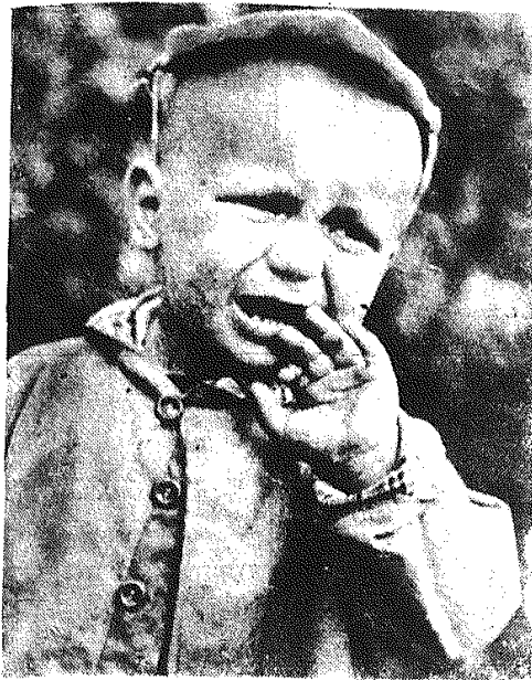
W piątek - 3 czerwca otwiera reje Pokonkursowej Wystawy Fotograficznej pt. „Dziecko” organizowanej przez „Magazyn Niedzielną” „Słowa Ludu” i Kielecki Oddział Polskiego Towarzystwa Fotograficznego. (Autorem tego zdjęcia pt. „Bywa i tak” jest Jerzy Kamoda, zdobywca pierwszej nagrody w naszym konkursie).