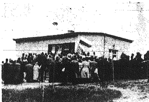
Jak już informowaliśmy, w ubiegłą niedzielę w Nowej Słupii otwarte zostało Muzeum Starożytnego Hutnictwa Świętokrzyskiego. Na zdjęciu: Muzeum w chwili po otwarciu. Przybyli na uroczystość goście oraz mieszkańcy Słupii zwiedzają Muzeum.

- Jak ocenia się wyniki ekonomiczne pierwszych miesięcy 1960 roku? Jaki postęp osiągnięto w zakresie porządkowania gospodarki zakładów? - Sytuację gospodarczą kraju w okresie 4 miesięcy br. charakteryzuje przede wszystkim zadowalające wykonywanie zadań planu w podstawowym dziale gospodarki narodowej, jakim jest przemysł. Przekroczył on dość znacznie, bo o 2,9 proc., założony w planie poziom produkcji. Plan produkcji globalnej przemysłu w okresie 4 miesięcy br. został wykonany przez wszystkie podstawowe resorty przemysłowe, a ogólne rozmiały produkcji wzrosły, w porównaniu z odpowiednim okresem 1959 r., o 9,9 proc. Na podstawie dotychczasowych danych można powiedzieć, że w pierwszych miesiącach br. gospodarność w przedsiębiorstwach przemysłowych istotnie (Dokończenie na str. 2)