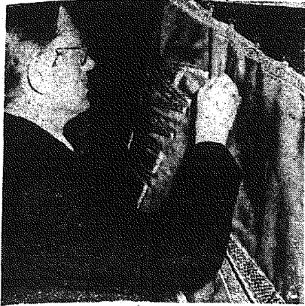
15.X.1960 r. podczas uroczystej sesji Rady Narodowej miasta Łodzi, przewodniczący Rady Państwa Aleksander Zawadzki udekorował sztandar miasta Orderem „Budowniczy Polski Ludowej”.