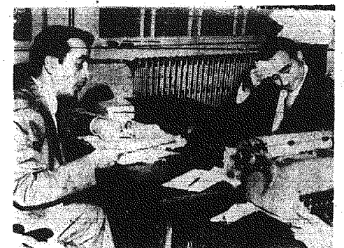
Do niedawna jeden z filarów amerykańskiej polityki na Bliskim Wschodzie b. premier turecki Menderes podczas przelotu w wycieku w Stambule.

nym poparciem ze strony kół rządzących w Japonii aktywizują się prawnicze bandyckie i faszystowskie organizacje. Członek jednej z takich organizacji dokonał zabójstwa przywódcy partii socjalistycznej, Asanumy. Fakt ten wywołał oburzenie japońskiej opinii publicznej, która domaga się ustąpienia rządu Ikedy. Dlatego