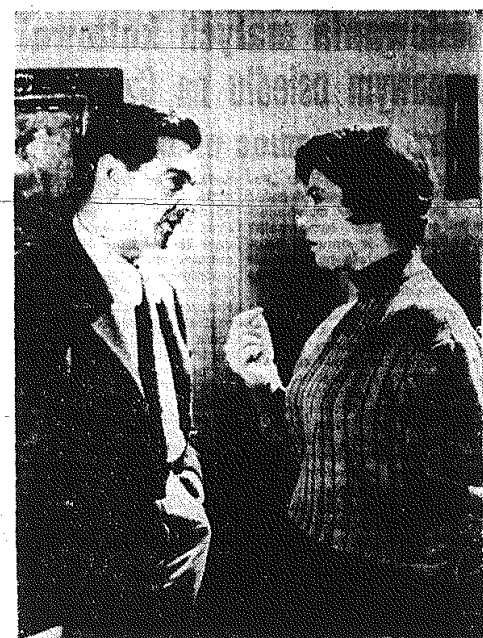
Tatjana Samojowa - znana aktorka radziecka grać będzie jedną z głównych ról w nowym filmie węgierskim „Alba Regia”...